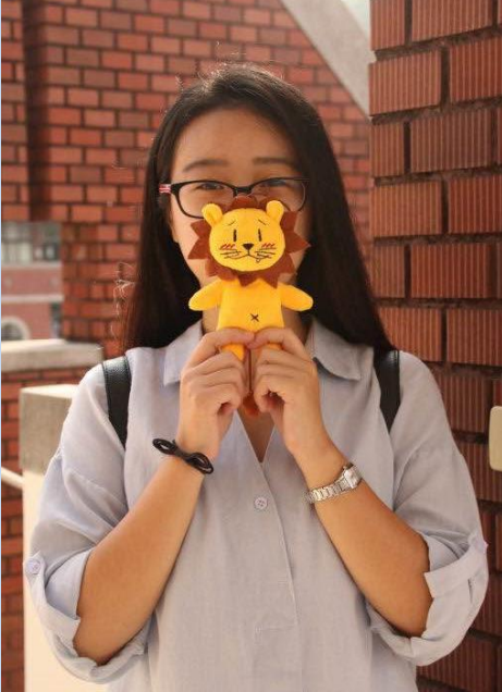
摄于大叶大学行政大楼