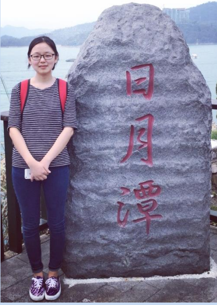
照片说明:与学校组织的户外之旅 -日月潭环湖一日游

好，所以全民素质高，难怪一句中国的文化在台湾。台湾回来之后，爸妈都觉得我懂事了不少，渐渐用大人的眼光对待我，我开始渐渐懂得一些人情世故，会帮爸妈做事，会去体谅父母，最重要是我独立了不少，不再是原来那个稚嫩的我，还带了一身的礼貌回来。对于台湾，我只想说，等我，我还会来。对于这趟交换之旅，我还是感谢，感谢上天，感谢父母，感谢学校，给我这么宝贵的机会。你让我成长。